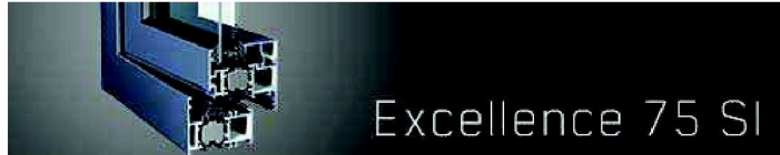
Excellence 75 SI